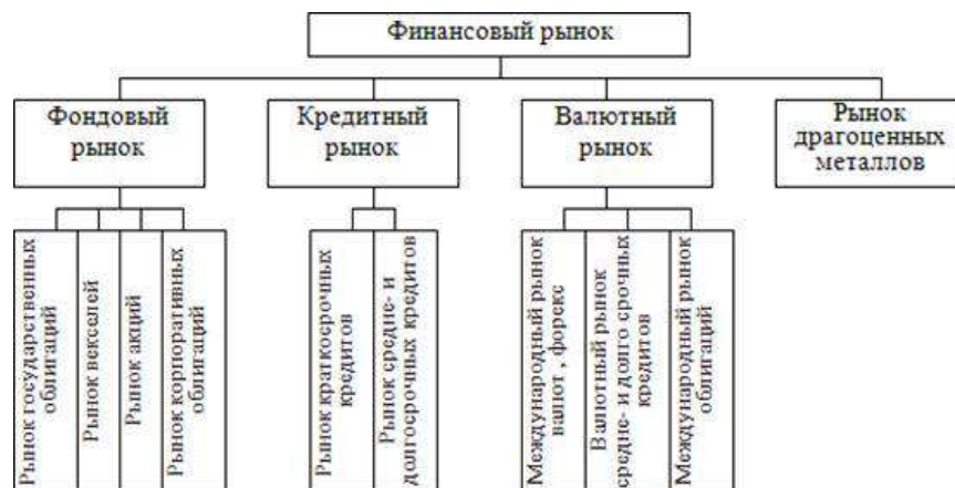
Рис. 1- Виды финансовых рынков в зависимости от торгуемых на них инструментов

— Валютный рынок. Финансовым инструментом на этом рынке выступает валюта, которую покупают/продают участники рынка (банки, брокерские компании, инвестиционные фонды, частные трейдеры). Операции на валютных рынках подразделяются на депозитно-кредитные и конверсионные. Одним из сегментов валютного рынка является рынок форекс. На валютном рынке осуществляются следующие операции – спекуляция, хеджирование, передача покупательной способности, арбитраж процентных ставок.[4, с. 312]