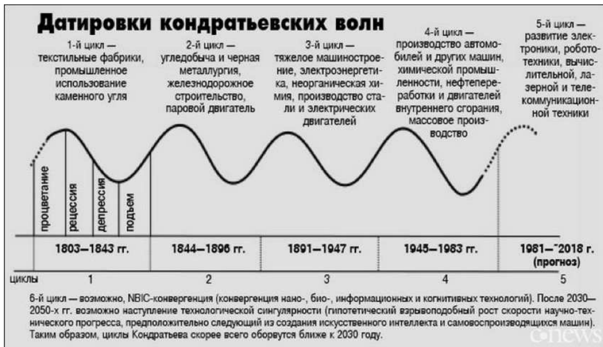
Рис. 3 – Датировка длинных волн Кондратьева

Современный цикл развития характеризуется тем, что кроме обычных циклических кризисов общего перепроизводства существуют так называемые структурные кризисы, которые не укладываются в рамки одного воспроизводственного цикла. Структурный кризис поражает спрос на продукцию, который растет медленнее, чем экономика в целом, а иногда и абсолютно сокращается. К таким отраслям относятся: черная и цветная металлургия; угольная промышленность.